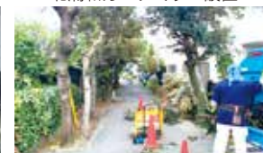
岸町小通学路整備