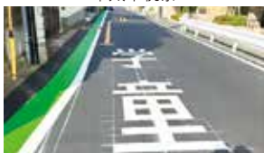
常盤小スクールゾーン整備