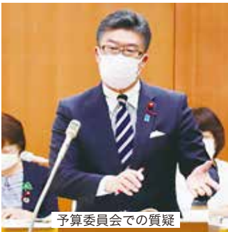
予算委員会での質疑