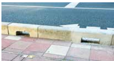
中山道水捌け工事