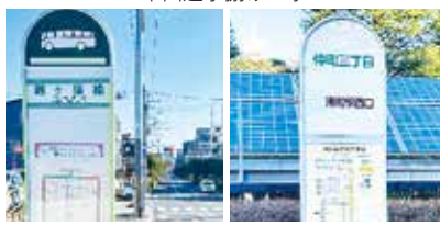
市役所通りのバス停と新路線整備