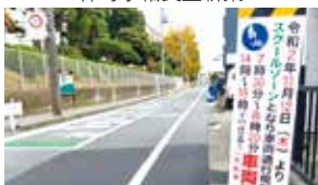
仲町小スクールゾーン整備