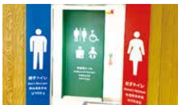
中の島地下トイレの改修