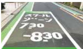
岸町小スクールゾーン整備