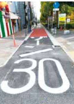
常盤小スクールゾーン整備