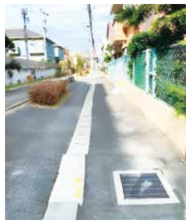
別所沼遊歩道の浸水防止