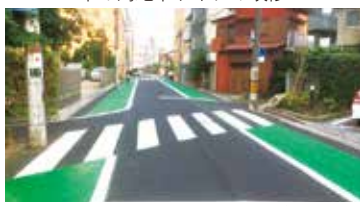
常盤9丁目スマイルロード整備