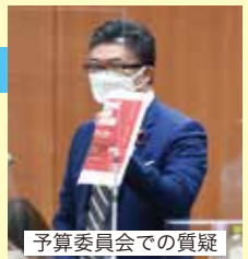
予算委員会での質疑