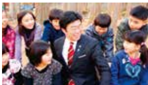
仲町小給食室新築