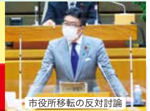
市役所移転の反対討論

住民無視・住民不在も甚だしい。令和4年4月臨時会で、さいたま市役所移転が強行採決されました! (浦和区で反対したのは私1人)