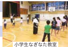
小学生なぎなた教室