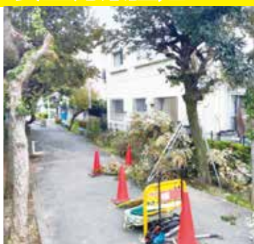
岸町小前の遊歩道整備