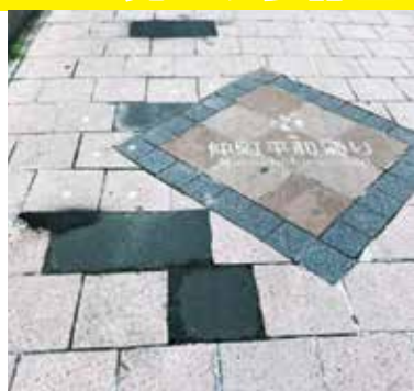
仲町平和通りの改修