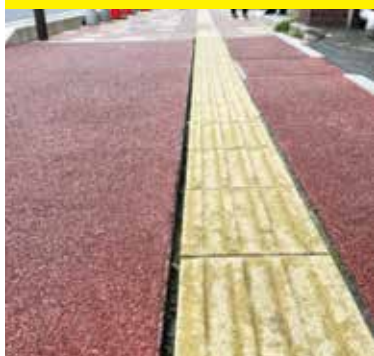
点字ブロックの修繕