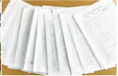
さいたま市役所近隣住民商店有志一同により「さいたま市庁舎移転計画の近隣説明会等開催の要望書」を提出(令和3年12月)