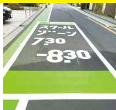
岸町小のスクールゾーン補修