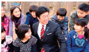
仲町小給食室新築