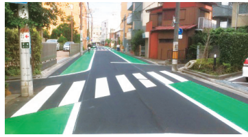
常盤9丁目スマイルロード整備