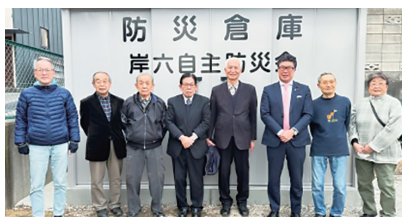
岸町6丁目防災倉庫の設置