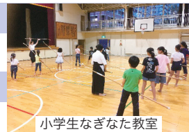
小学生なぎなた教室

小中学校のトイレの改善、洋式化の実施。体育館のエアコン設置推進。 通学路の改善・補修等安全対策の実施。(仲町小、常盤小、岸町小等) 全国1位を続ける英語教育「グローバルスタディー」の推進。 タブレット等ICT化導入を全ての市立小中学校で実施しました 仲町小学校校舎増築工事が完了。仲町小学校、常盤小学校内へ放課後児童クラブを開設。 幼児からのスポーツ・武道の推進。青少年育成活動の推進