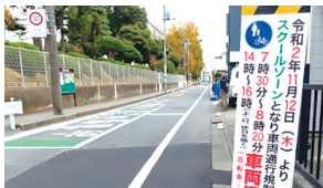
仲町小スクールゾーン整備