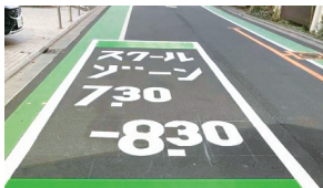
岸町小スクールゾーン整備