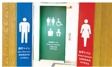
中の島地下トイレの改修