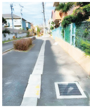
別所沼遊歩道の浸水防止