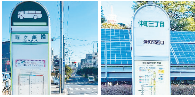
市役所通りのバス停と新路線整備