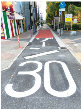
常盤小スクールゾーン整備